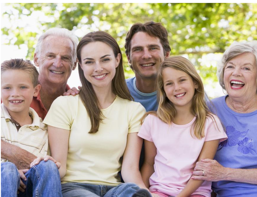
Implantate sind ab 18 Jahren bis in's hohe Alter möglich. Sie geben Sicherheit beim Reden und Lachen und sie ermöglichen es, wie mit eigenen Zähnen zu beißen und zu kauen.

Wenn die Nachbarzähne schon sehr stark gefüllt oder geschädigt sind, kann es besser sein, eine Brücke zu machen. Durch die Kronen werden die Zähne stabilisiert, so dass sie länger halten können.