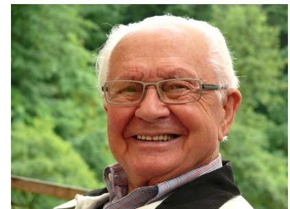
Implantate ersetzen fehlende Zähne fest und komfortabel. Sie haben eine hohe Erfolgsquote und lange Haltbarkeit.

Auch aus diesem Grund entscheiden sich immer mehr Patienten für diese bewährte Art des Zahnersatzes.