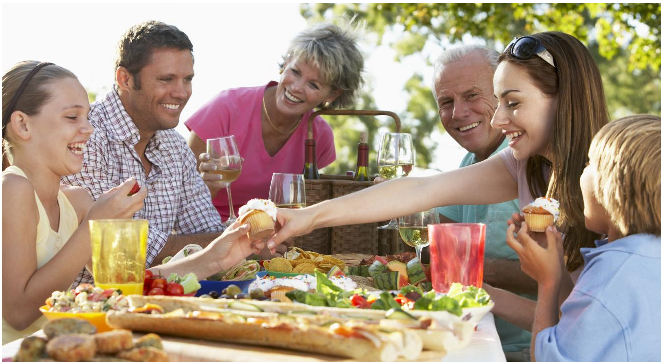
So macht das Leben wieder richtig Spaß: Mit komplett festsitzenden Zähnen essen, reden lachen und sich im Kreis der Familie wohlfühlen.

Wie Sie wieder komplett fest sitzende Zähne haben können