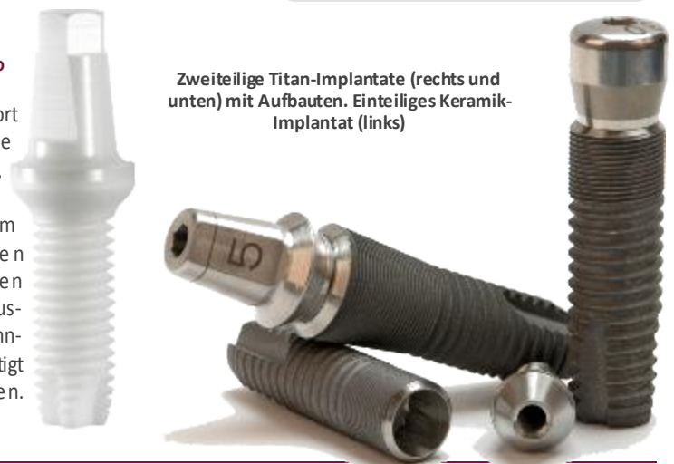
Zweiteilige Titan-Implantate (rechts und unten) mit Aufbauten. Einteiliges Keramik-Implantat (links)